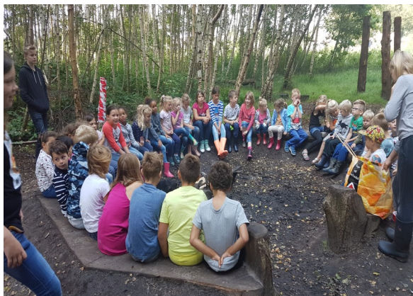
Broodjes bakken en een speurtocht in Vos & Bos

We hopen dat dit initiatief ook volgend jaar voortgezet kan worden. Mochten ook andere bewoners ideeën hebben, laat het ons weten.