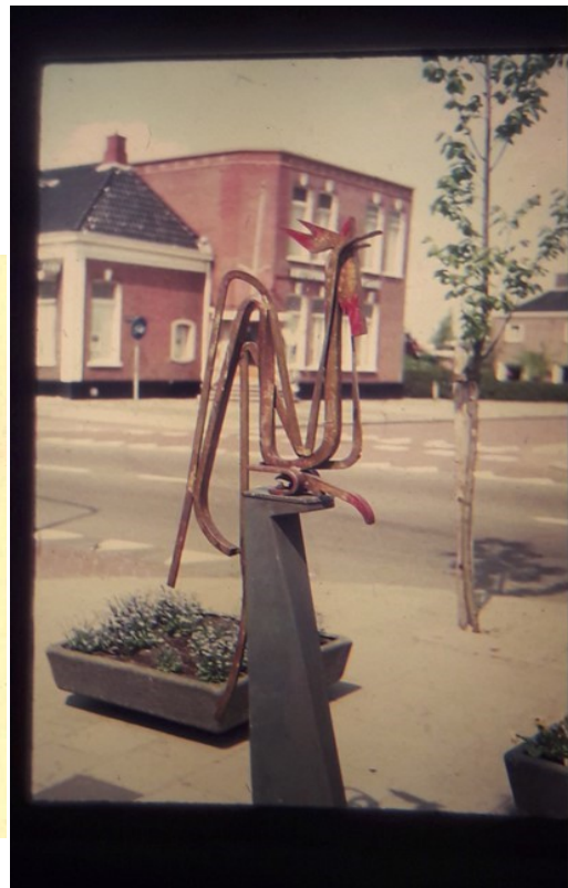
Haan in de 70 er jaren.