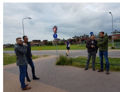
Met wethouders en raadsleden ter plekke gekeken.

Zowel de basisscholen in de wijk, onze bewonersorganisatie en wijkcommissie De Vossenstreek hebben bij de gemeente aangegeven niet gerust te zijn over de veiligheid van de fiets- en voetgangersoversteek over de Croonhoven. De gemeente heeft na drie metingen geconcludeerd dat er nog duidelijker gemaakt kan worden dat het om een schoolroute gaat. Er staan inmiddels felgele borden bij. We vragen ons af of dat voldoende is en hebben Veilig Verkeer Nederland om een second opinion gevraagd. Daar is nog geen uitslag van. We hebben aangegeven dat we verwachten dat de route drukker zal worden als de twee basisscholen in Boswijk verhuizen naar De Vosholen.